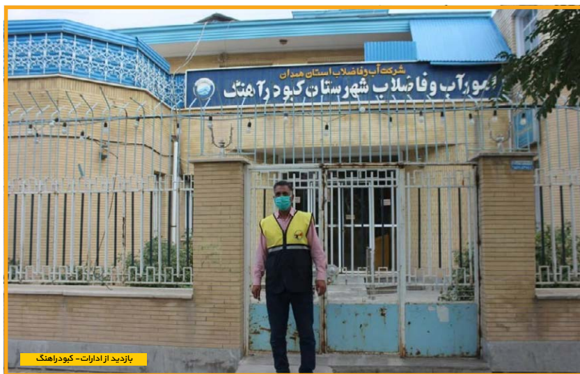
بازدید از ادارات - کیودرهنگ