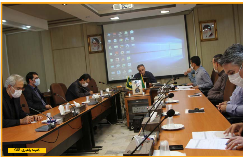
کمیته راهبری GIS