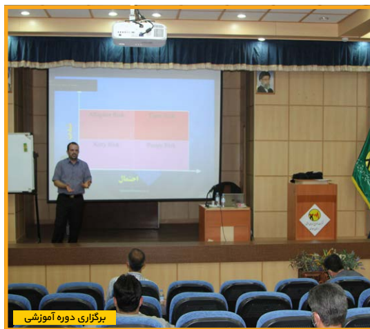
برگزاری دوره آموزشی