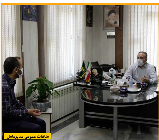
ملاقات عمومی مدیرعامل