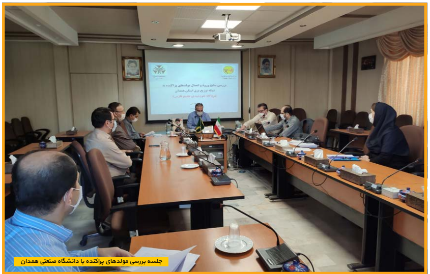
جلسه بررسی مولدهای پراکنده با دانشگاه صنعتی همدان