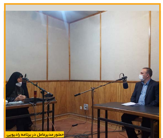
حضور مدیرعامل در برنامه رادیویی