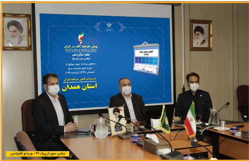
چشم‌پوشی آبگرم با ۹۹- ویدئو کنفرانس