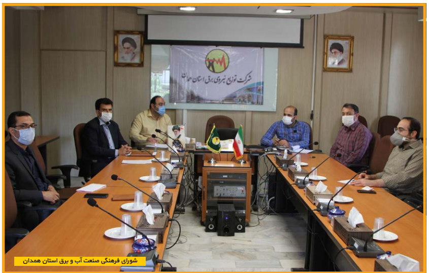
شورای فرهنگی صنعت آب و برق استان همدان