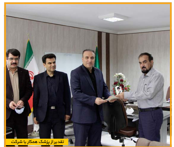
تقدیر از پزشک همکار با شرکت