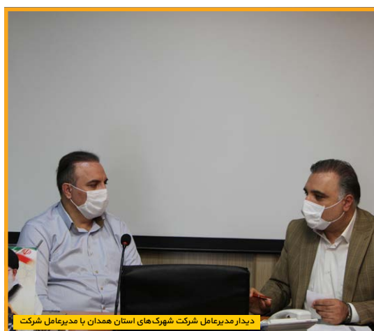
دیدار مدیرعامل شرکت شهرک‌های استان همدان با مدیرعامل شرکت