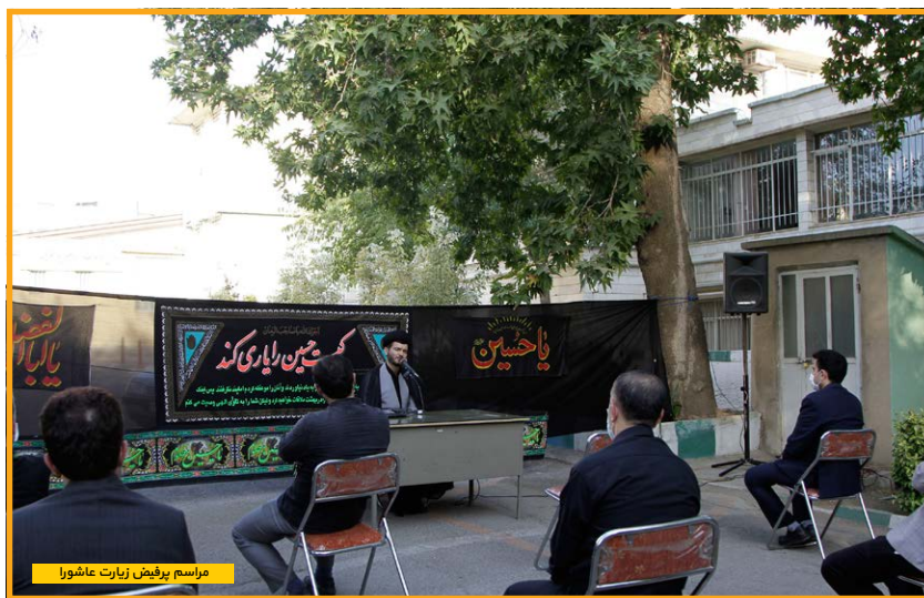
مراسم پرفیض زیارت عاشورا