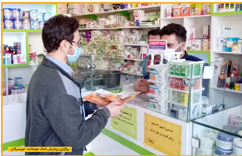
برگزاری آزمایش کمک مومنانه - توپسرکان