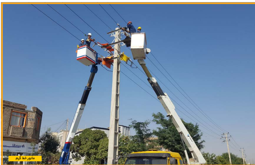
مانور خط گرم