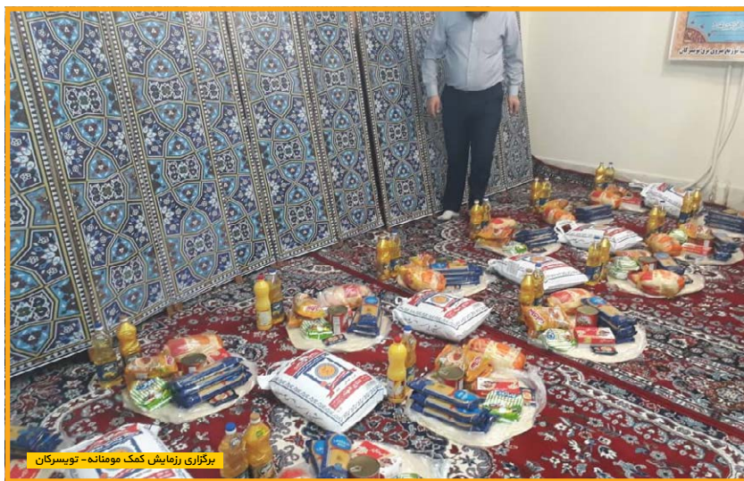
برگزاری آزمایش کمک مومنانه - توپسرکان