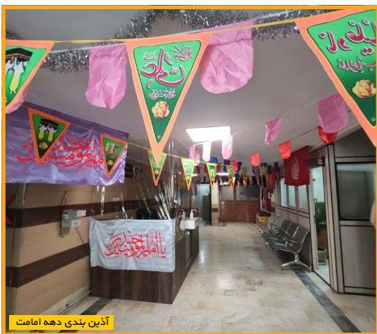
آذین بندی دهه امامت