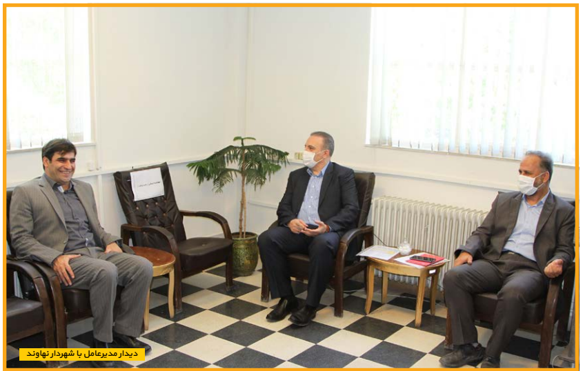
دیدار مدیرعامل با شهردار نهاوند