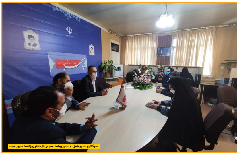
سرکشی مدیرعامل و مدیر روابط عمومی از دفتر روزنامه سپهر غرب