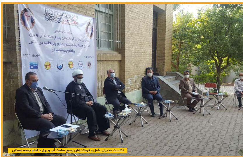
نشست مدیران عامل و فرماندهان بسیج صنعت آب و برق با امام جمعه همدان