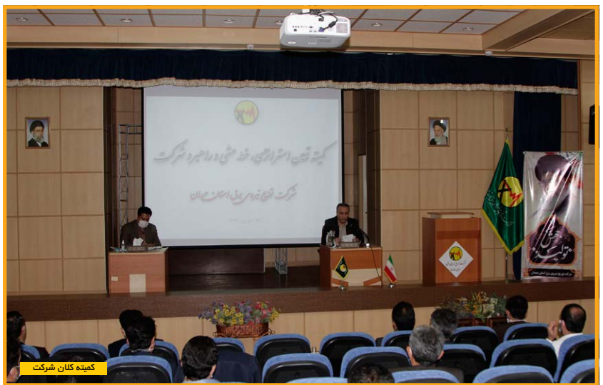
کمیته کلان شرکت