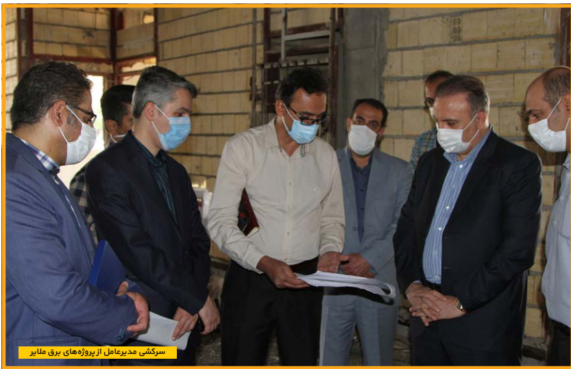
سرکشی مدیرعامل از پروژه‌های برق ملایر